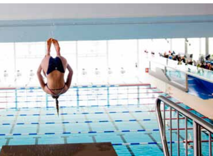
ELEGANT: Med smidige og elegante stup imponerte utøverne fra stupeklubben de fremmøtte.