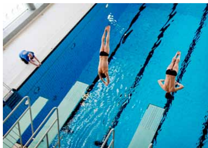
STILFULLT: Det hørtes tydelige gisp blant publikum da stuperne gjorde sine krumspring.