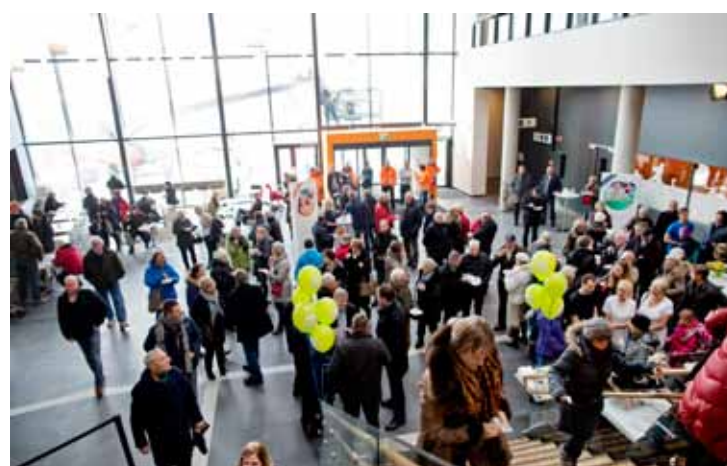
ÅPNINGSFEST: Aquarama åpnet fredag etter å ha vært planlagt siden 1997. Sammen med Kilden og Idda skal anlegget løfte byen og gjøre den mer attraktiv.